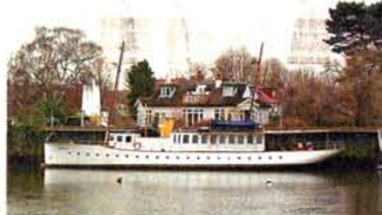
停泊在河邊的這艘小蒸氣船，以往曾屬於瑞典國王。

烈治文宮現在已變成私人住宅，古風卻不減。從王宮向外踩單車踩了一會，到達了泰晤士河岸，這裏沒有偉大的古蹟，卻有小橋與古老樓房。小鎮風情與倫敦市中心的繁忙河段有天壤之別，一路上散步、慢跑、踩單車的人不少，寧靜的環境裏充滿活力，在平緩的河岸上踩單車真是一大樂事。我們沿傾斜的夜鶯徑(Nightingale Lane)上到烈治文公園外的小山崗，在此可東眺倫敦市容，這裏更是此區地價最高的地段。由馬路轉入烈治文公園，經過的都是沙泥的林道，讓騎車人可享受off road樂趣。離開公園，我們來到Ham這個小社區，建於1610年的Ham House是區內最有代表性的大宅，結合了法國、荷蘭、意大利的建築風格。社區仍保存貴族遺風，居民熱愛馬術與馬球，人們在馬路上騎馬並不鮮見。