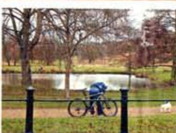
香港人喜歡遛狗散步，英國人卻喜歡踩單車，人與小狗都可以做更多運動。