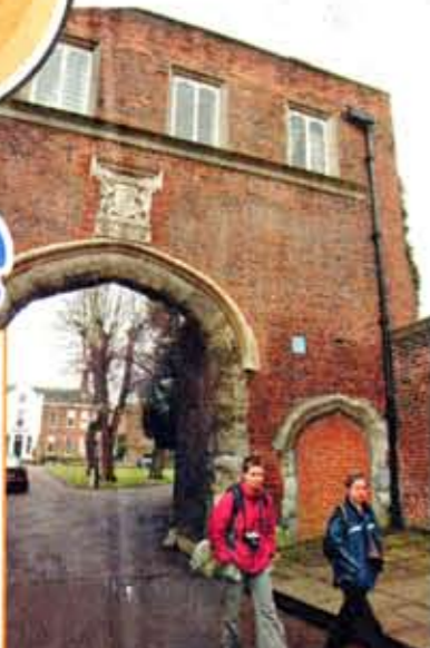
烈治文宮宮門上仍保留了亨利八世的皇者徽號。

費用：一日遊$475，兩日一夜$3,361(每位計，以兩人一房為標準，住漢普頓宮河畔4星級酒店，包晚餐；旅程不包導遊，但提供地圖及諮詢服務) 每天里程：由18至59公里不等，依各人能力而定。我當天約用了8小時，游走了20公里路。 技術需求：一般(頗需體力) 路途地勢：大致平坦 查詢：Capital Sport 地址：The Red House, Aston Clinton, Buckinghamshire, HP225EZ 電話：(44)11-296631671 網址：www.capital-sport.co.uk