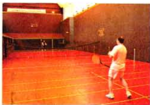
皇家網球場位於Tennis Court Lane內，球場在1740年舉行的世界賽是最早的世界性體育比賽。

離開Ham House，我們到達泰晤士河的更上游，車輪滾着沿河的泥路，環境更幽靜。Teddington附近是古老運河的船閘，因為受海潮的影響，泰晤士河河岸有時會氾濫，但自Teddington以上的地區則不受影響，所以船艇上溯河道須靠船閘。在這狹窄的河道，人們仍以河水為樂，周末經常舉行帆船比賽，在狹河中航行，需要很高技術。