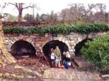
在烈治文公園旁的橋是遊人往公園的通道，又是露宿者的家。