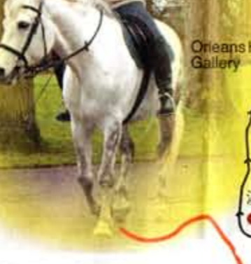
在馬路上，騎馬當然是合法的。