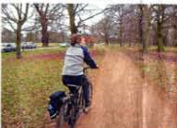
單車經烈治文公園，園內都是樹林與泥路，充滿郊區自然氣息。